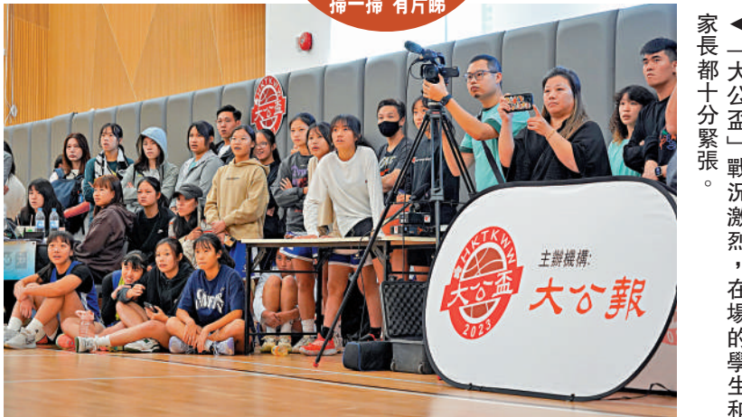
▲「大公盃」一戰激烈，在場的學生和家長都大受鼓舞。