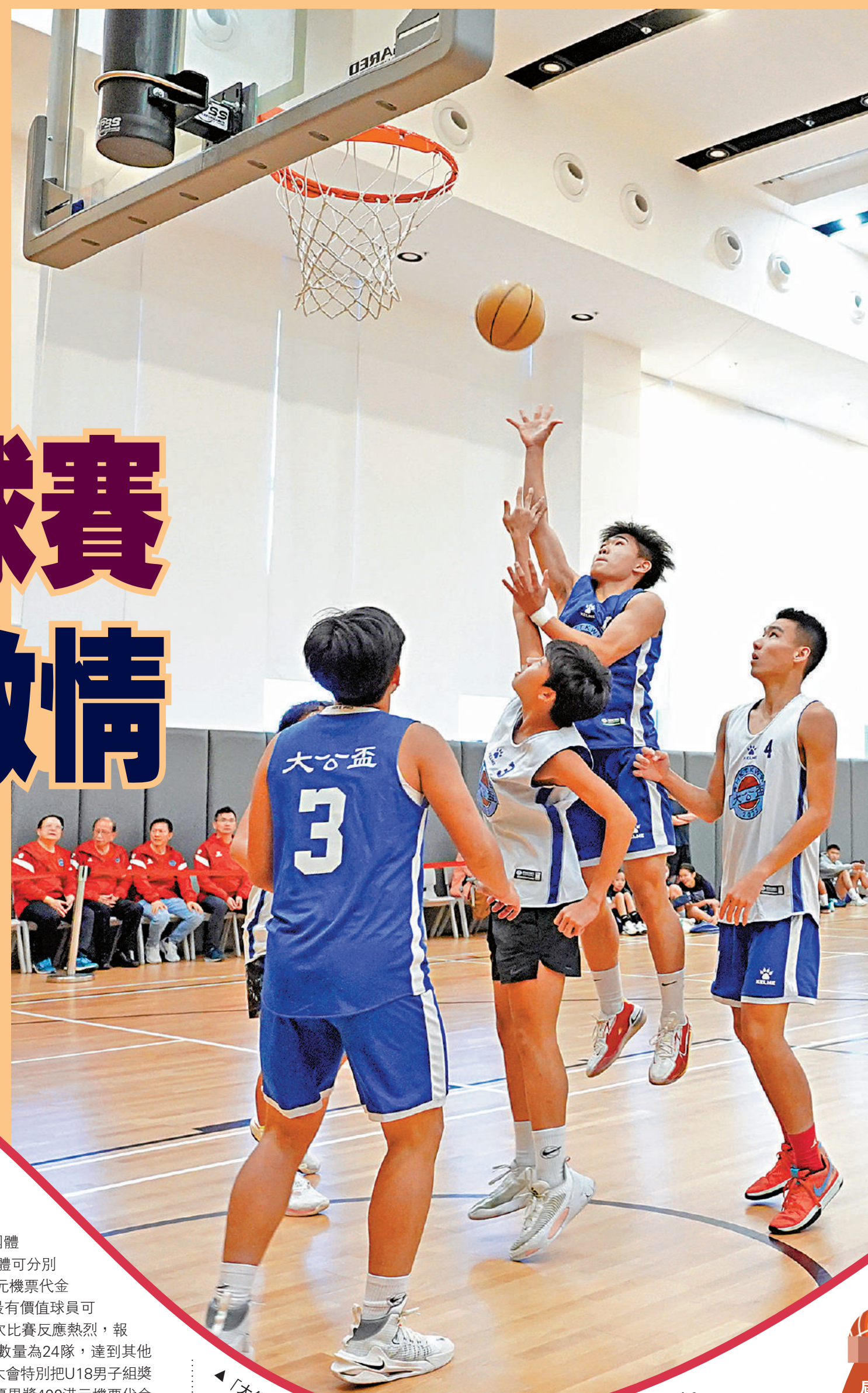
「大公盃」三人籃球賽昨日舉行多場決賽，健兒們使出渾身解數，爭取勝利。